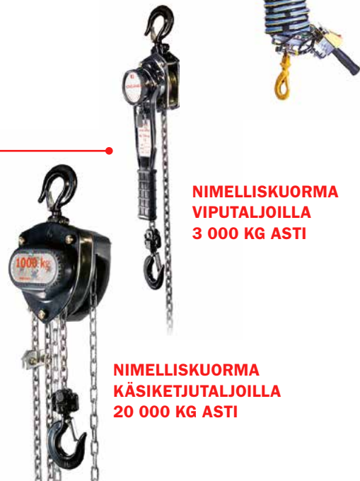
NIMELLISKUORMA VIPUTALJOILLA 3 000 KG ASTI