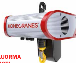
NIMELLISKUORMA 5 000 KG ASTI