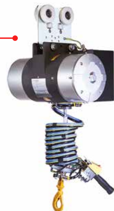
NIMELLISKUORMA 350 KG ASTI