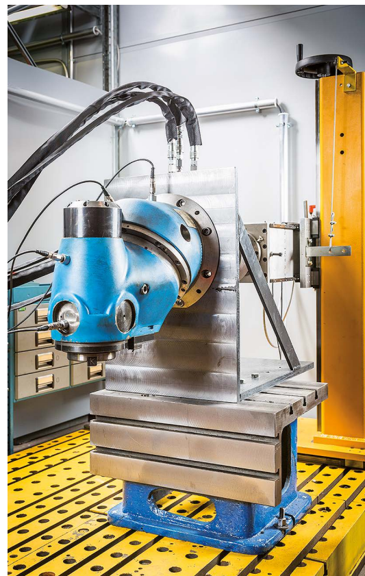
Testipenkki Hyvinkään toimipisteessä.

Hammaspyörien valmistus ja toimitus onnistuu myös kumppaniverkostomme avulla nopeasti.